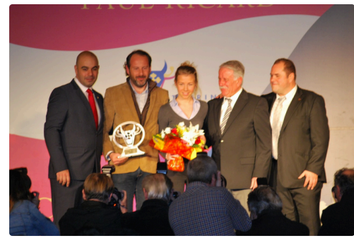
Le Lartet gagnant pour la 9 e fois