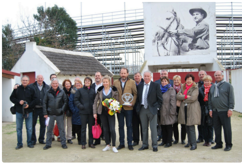
Les Amis du Lartet étaient nombreux a Méjanes