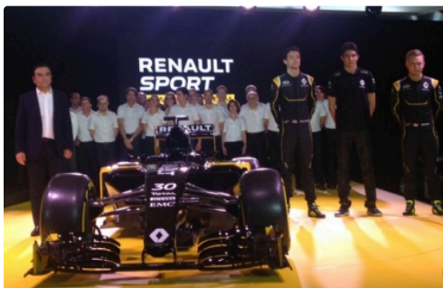
renault f1 12.jpg

Plusieurs saisons probablement pour revenir au top, trois minimum affirment les spécialistes qui soulignent aussi le changement de règlement à l'horizon 2018 comme élément favorable.