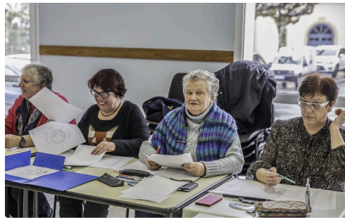
Autre partie de l'assistance