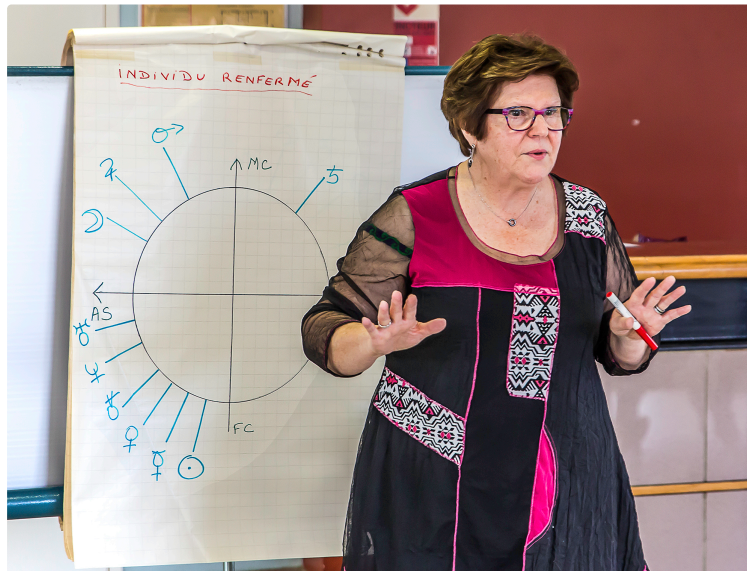
Cours d'astrologie à Caupenne-d'Armagnac

Les Papillons jaunes ont été convaincus : l'astrologie, c'est sérieux