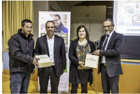
Remise des jeux éducatifs à des parents d'élèves