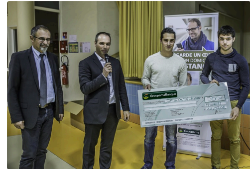
Remise d'un chèque à de jeunes viticulteurs