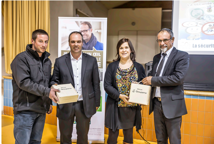
La Caisse d'Aignan de Groupama en assemblée générale

Des infos sur les risques et la prévention des accidents et des vols