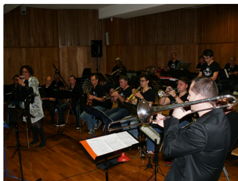
Pavie Jazz Combo.