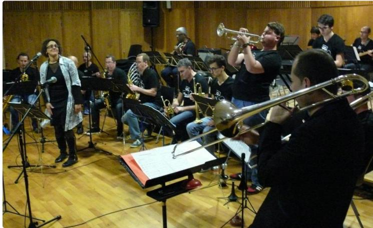
GROS SUCCES DU CONCERT DE L'ECOLE DE MUSIQUE

Pavie Jazz Combo et l'ensemble orchestral de l'école de musique ont fait salle comble