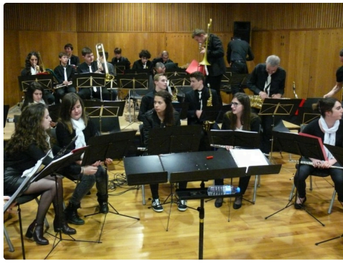
Mise en place de l'ensemble orchestral.