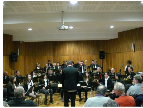
Prêts à jouer le premier morceau "Toulouse" de Claude Nougaro.