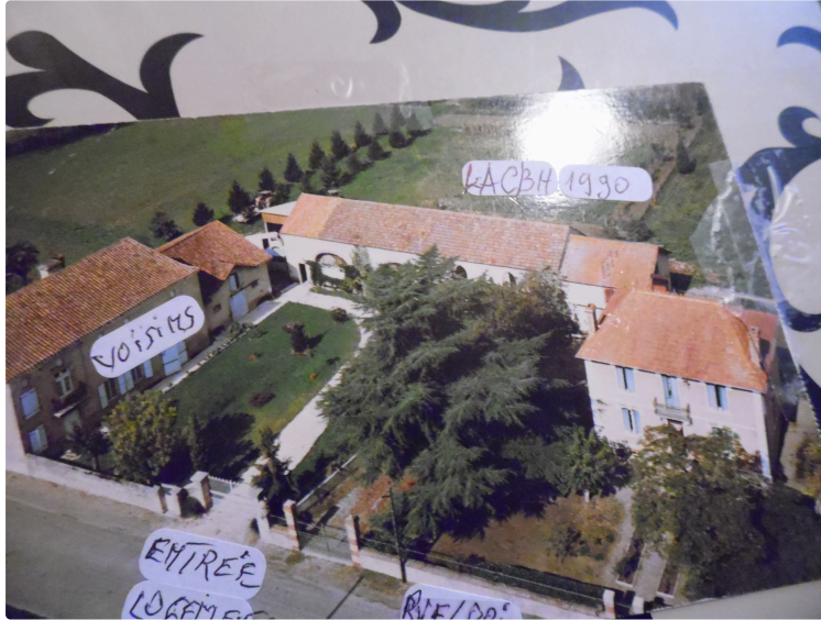
Pro-Patria le premier gagnant du prix d'Amérique est enterré a Préchac sur Adour

Il avait gagné la course en 1920 et 1921