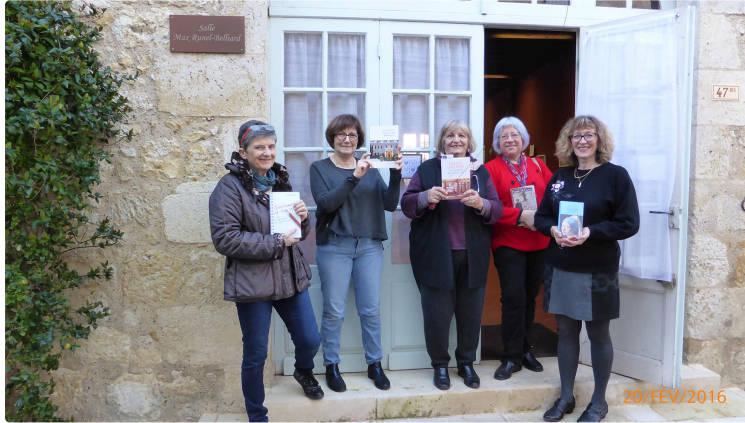
Ouverture d'une bibliothèque associative à Terraube

Samedi 20, ouverture d'une bibliothèque associative au coeur du village.