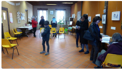
La bibliothèque siège dans la salle Ranel Belliard, qui sera très prochainement entièrement rénovée et offre de larges possibilités pour les grands et les petits.