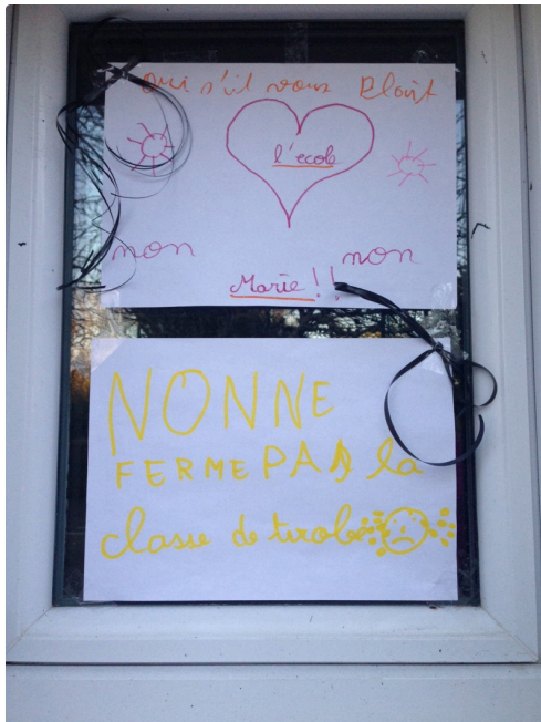
Jusqu'aux fenêtres, tous les espaces ont été occupés par les enfants.