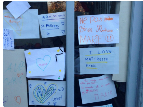
La garderie aussi...