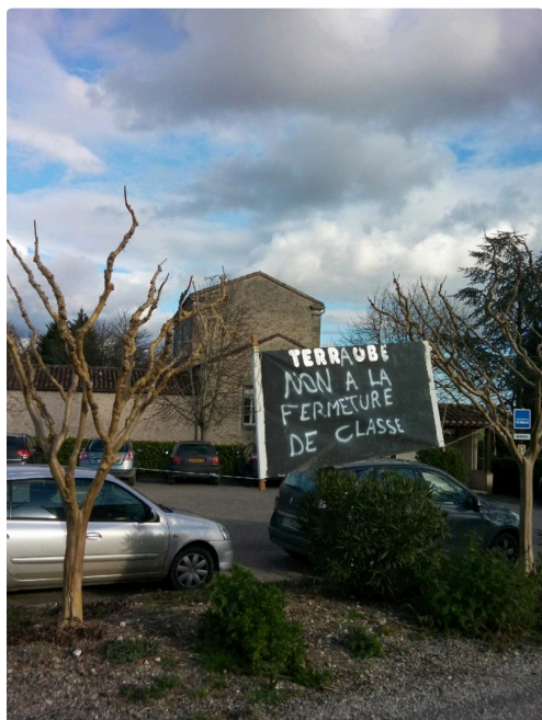
Les panneaux d'information sont mis en place.

http://www.petitions24.net/fermeture_dune_classe_ecole_terraube