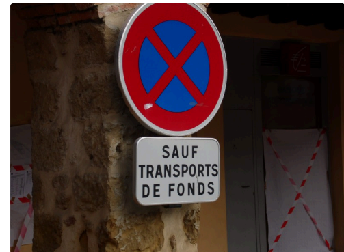
Le panneau sera maintenant plus utile sur l'autre place