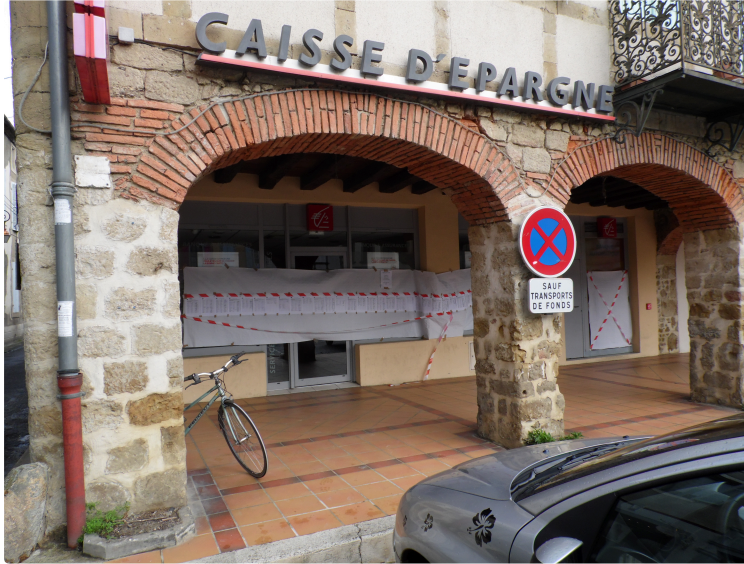
L'agence de Caisse d'Epargne qui ferme fin mars

L'expression de la colère qu'expriment les Plaisantins devant la décision irrévocable de "La Caisse d'Epargne" de fermer le bureau de Plaisance pour aller à Marciac n'est pas dirigée contre le voisin Intercommunautaire qui n'en est pas plus responsable que Nogaro de la fermeture de Riscle ou Rabastens de Bigorre de celle de Maubourguet mais bien parce que le fait accompli a été imposé . La réaction est, a été, et reste vive jusqu'à l'outrance écrite parfois, mais en cette période où les fermetures se font ou menacent de se faire chacun à sa manière de réagir car après tout la France est heureusement une démocratie où tous peuvent librement s'exprimer . Devant l'agence de la Caisse d'Epargne de Plaisance ce mécontentement s'est exprimé ce vendredi matin , une grande banderole ou étaient accrochées les pétitions portant six cent signatures des mécontents a été accrochée sur la devanture . Cela ne fera pas réouvrir l'agence au delà de fin mars mais au moins les décideurs sauront à quel point Plaisance ne les aime plus maintenant . Bay bay l'écureuil les bruissements de la rumeur publique disent que les concurrents locaux se frottent les mains.