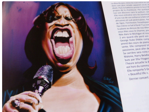
Dianne Reeves vue par un caricaturiste du livre Marciac Terre de Jazz