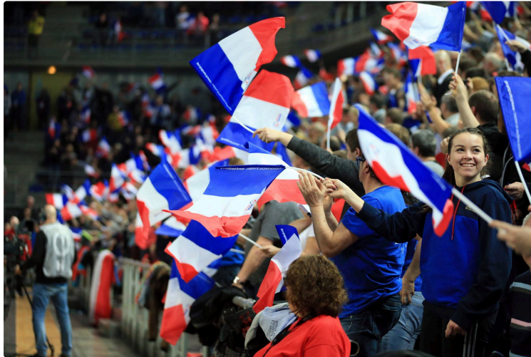
HANDBALL / QUALIFIÉES POUR RIO 2016