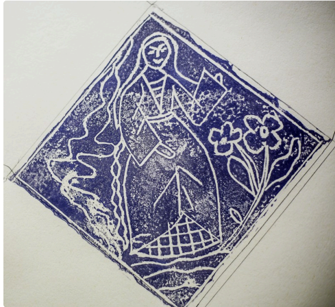
Travail en cours