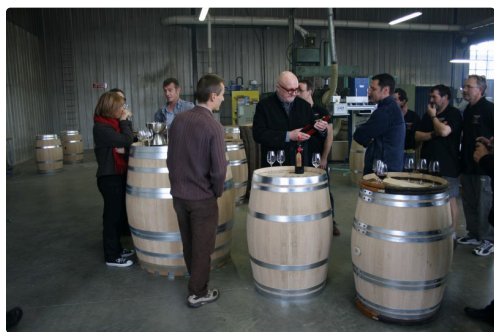
Le moment de partage avec toute l'équipe