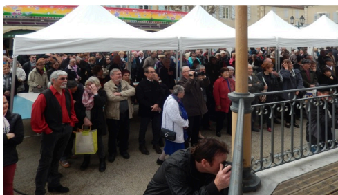
On se pressait autour de la distribution de tourteaux et de vin blanc