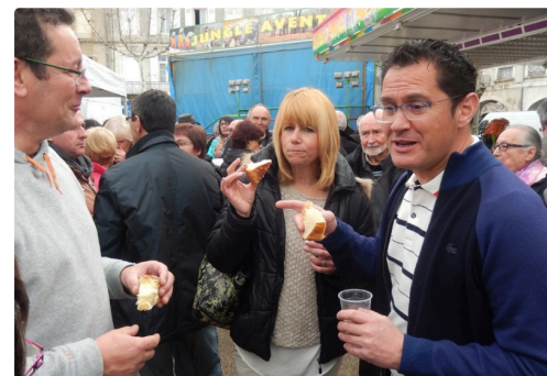
Ceux- là comme les autres ont apprécié