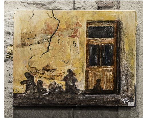
La porte d'Aignan, d'Anita Couzij