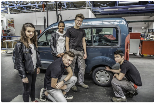
Une équipe au travail