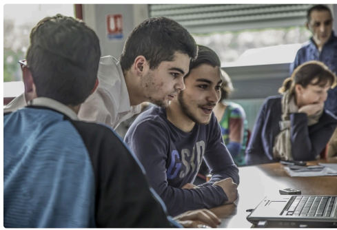
Une équipe aux commandes pour son diaporama