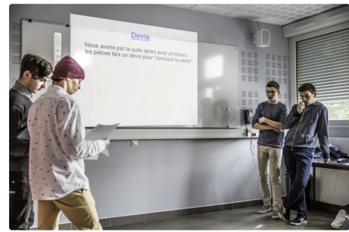
Des présentateurs unpeu intimidés