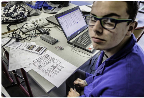
Calcul des réseaux et commandes électriques