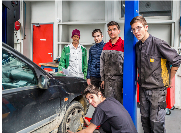
Semaine de la persévérance scolaire à la cité scolaire de Nogaro

Les 2es bac pro ont relevé des défis et pris les choses en main