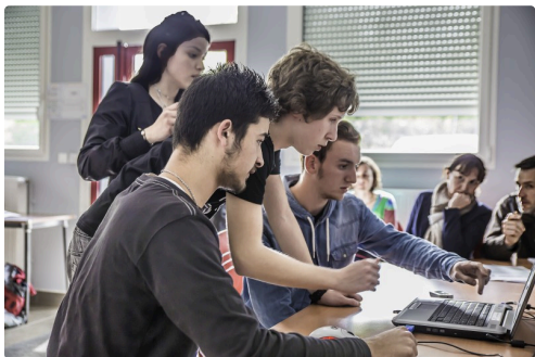
Une autre équipe avec son diaporama