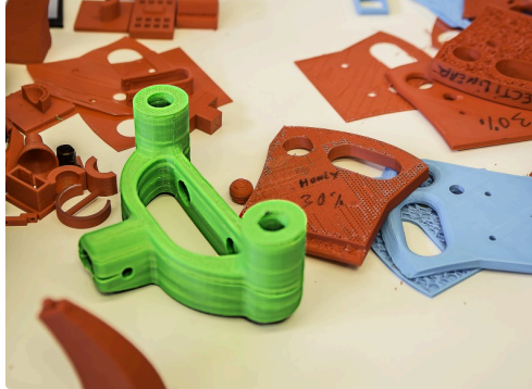
Quelques objets fabriqués avec la 3D