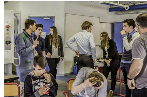
Beaucoup de discussions au sujet de la ligne de tri