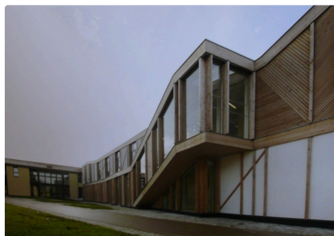
Façade nord de la cité de la transition énergétique.