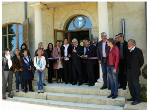
Le ruban tricolore coupé ouvre la porte à la "Cité de la transition énergétique".

Des locaux qui seront occupés au premier étage par les associations, Arbres et paysages, CAUE, et le GAAB 32, alors que le rez-de-chaussée sera dédié à l'accueil de séminaires, colloques, formations, et expositions.