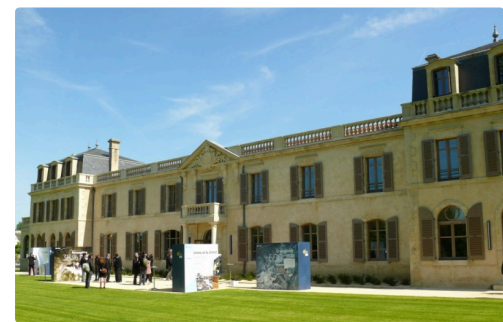
Façade sud de la cité de la transition énergétique.