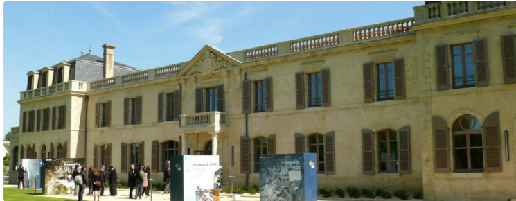
"La cité de la transition énergétique" inaugurée

La chartreuse de la Hourre réhabilitée est un exemple de la politique du développement durable du Département du Gers