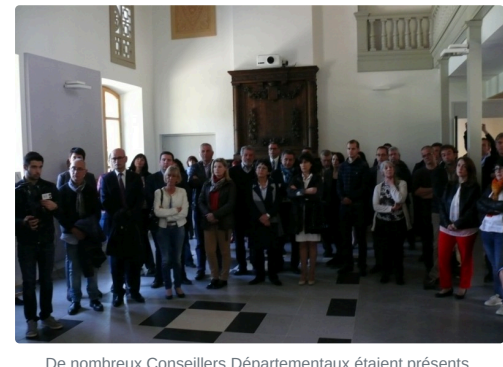
De nombreux Conseillers Départementaux étaient présents.