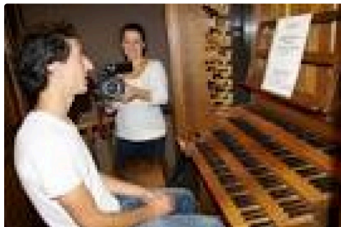
1 Marika avec Mika Fourcade lors de ses recherches Plaisantines