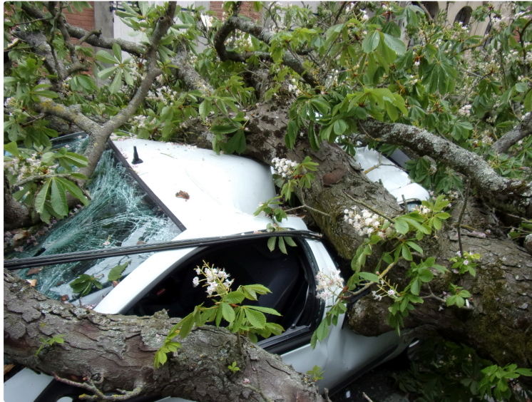
L'ISLE-JOURDAIN - les dommages du vent -