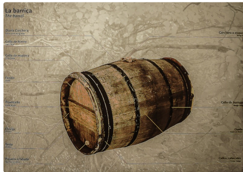
37bis description d'un tonneau 1bis 070516.jpg