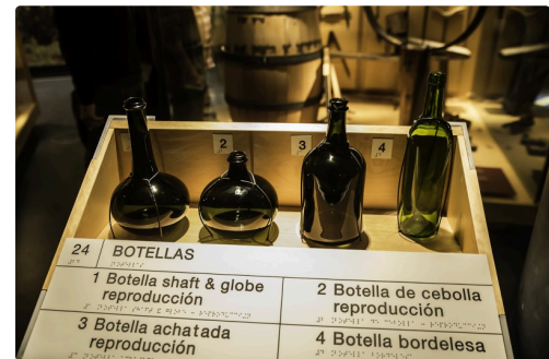
41 Bouteilles 1bis 070516.jpg