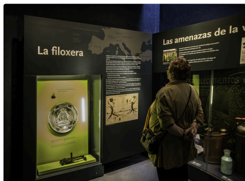
21 Le Phylloxéra 1bis 070516.jpg