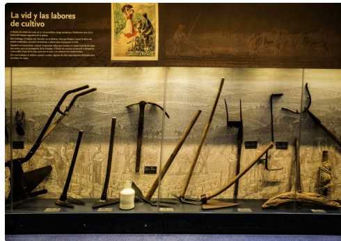
15bis Vitrine d'outils à main 1bis 070516.jpg