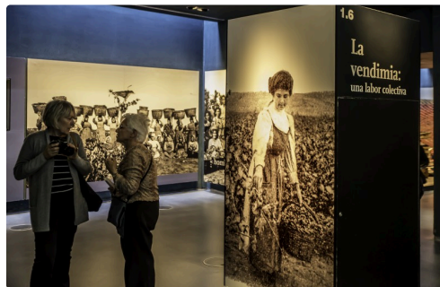
18 Les murs 1bis 070516.jpg