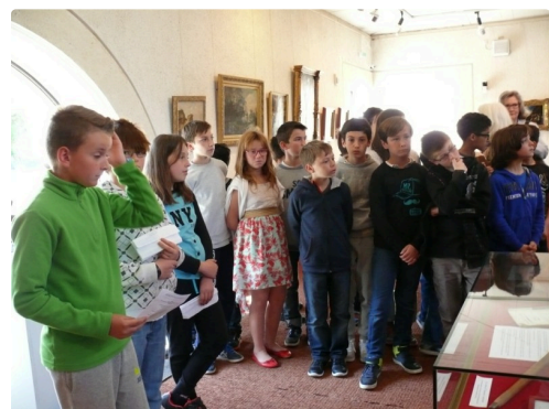
Une partie des élèves qui ont assisté à la cérémonie commémorative de l'abolition de l'esclavage.

Les élèves concluent la cérémonie par la lecture de textes se rapportant sur l'abolition de l'esclavage.