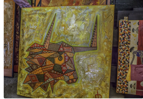
g Dans l'atelier 1bis 170516.jpg