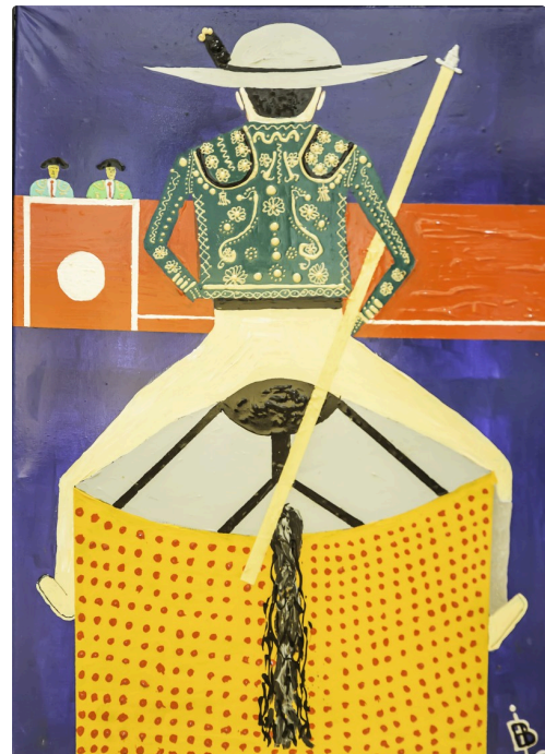
10 Expo Bruno Imart au Solenca 1bis 140516.jpg