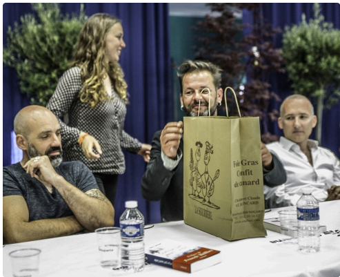
Des cadeaux de produits du terroir