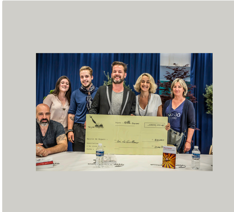
Les Rencontres littéraires de Nogaro, événement littéraire du Gers

Des débats passionnants sur la fabrication d'un roman