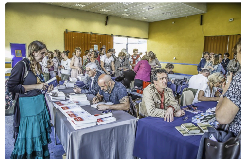
1 Dédicaces 1bis 200516.jpg