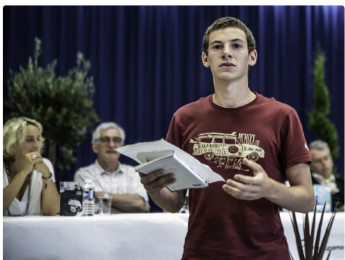
Présentation d'un ouvrage