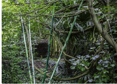
11 Bambous verts 1bis 270516.jpg