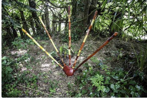
Land art de bambous avec coeur