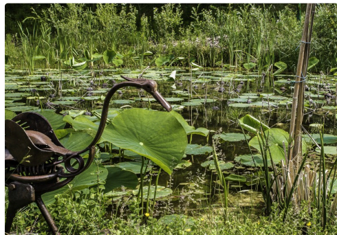
Le même avec son oiseau d'acier