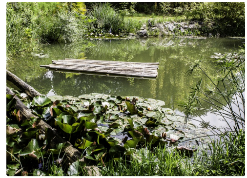
Le bassin aux cistudes