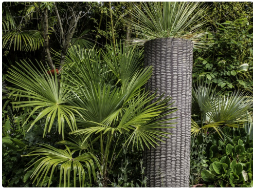
Colonne Bottagisio - Decoux dans son écrin