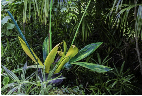
Au détour du chemin