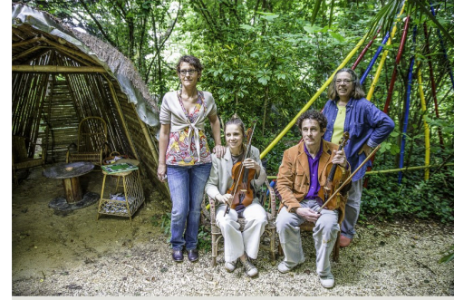
Près de la cabane, des bambous de toutes les couleurs