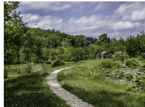
2 des 3 bassins étagés avec nénuphars et lotus