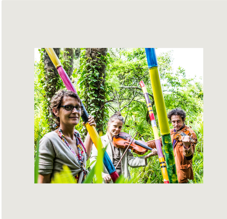
Le plus beau des « Rendez-vous au jardin » est à Bétous

À la Palmeraie du Sarthou, découvrir une nature exotique et des œuvres d'art