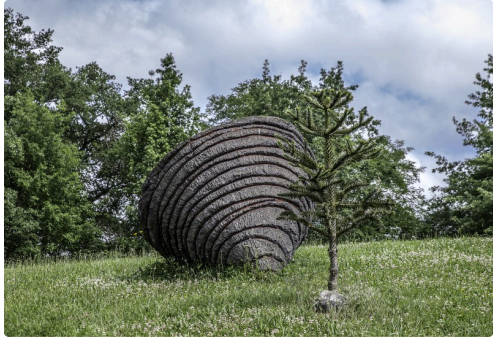
Toupie Bottagisio - Decoux