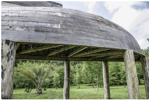
Le coin du repos en hamac