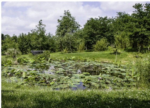
Bassin et ses nénuphars