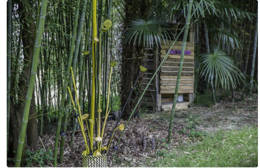
Et le petit coin...