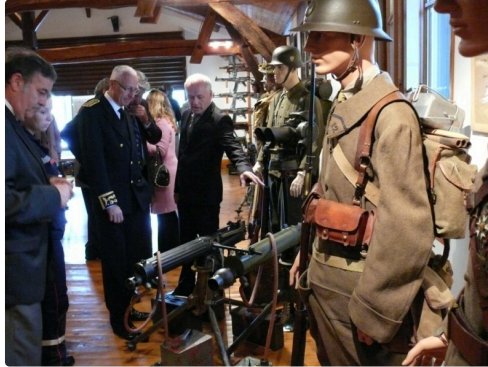
Le préfet visite le musée de la résistance.