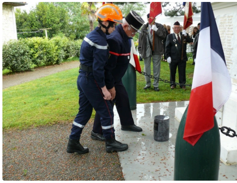
Un jeune sapeur pompier vient de déposer l'urne contenant de la terre du champ de bataille.