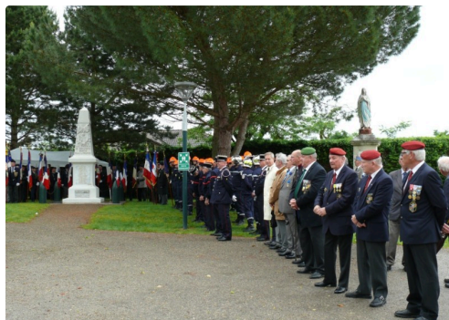
Une partie de l'assistance.

A l'issue de la cérémonie dont la partie musicale fut assurée par l'harmonie Fleurantine, le Préfet et les autorités civiles et militaires se rendirent au musée des Anciens Combattants pour la Liberté, le seul dans le département exposant des effets et objets datant de la Grande Guerre.