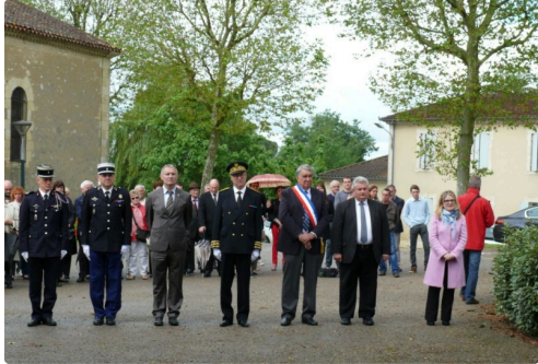
Les officiels lors de la commémoration.