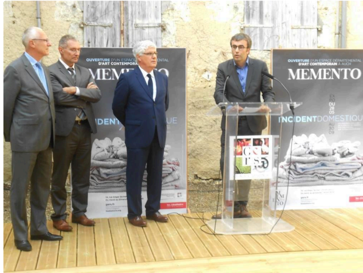
Memento: un lieu d'Histoire et de transition

Première expo d'art contemporain avec "Incident domestique"