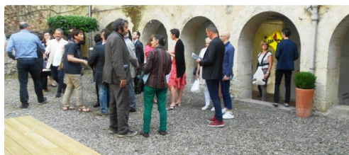
Le public se presse autour des arcades

A visiter absolument pour la magie des lieux et la particularité de l'expo, de plus le cloître intérieur est un espace de pause et détente, relié au WIFI, doté de distributeurs de boissons et en-cas.