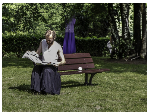
Le spectacle commence, l'artiste est cachée derrière un arbre