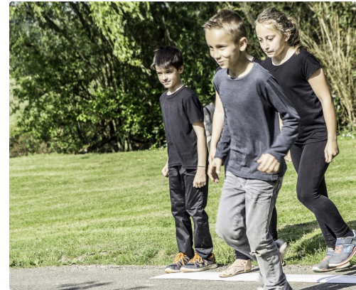
Evolutions des élèves de l'école de Manciet