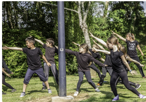
Evolutions des élèves de l'école de Manciet