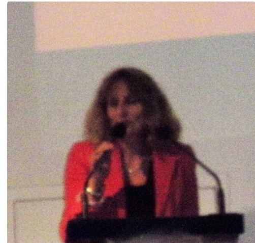
Mme la responsable des écoles en milieu rural