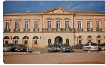
Conseil Municipal de L'Isle-Jourdain