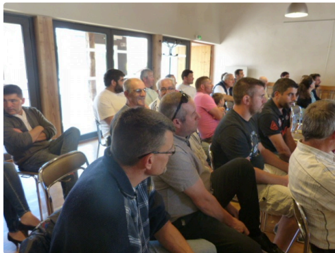
Une assemblée dense et à l'écoute