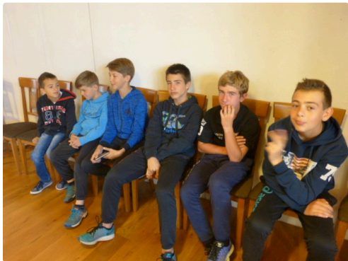
les jeunes espoirs du rugby