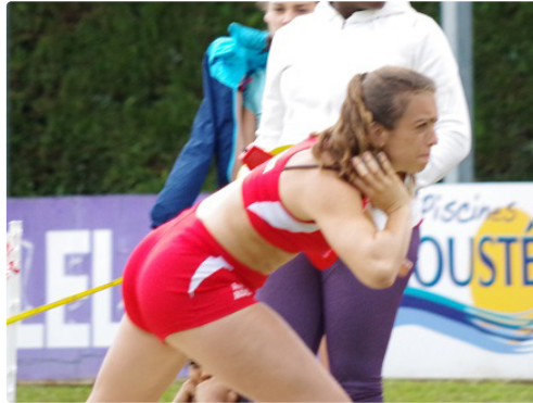
Meeting d'athlétisme d'Auch les performances étaient au rendez-vous

Samedi 18 juin c'était le rendez-vous annuel des pistards au stade Jacques Fouroux pour le meeting régional de l'AC Auch. Plus de 200 athlètes du grand sud ouest sont venus, et ont permis d'assister à de belles performances.