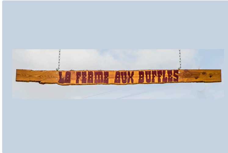
Aignan : la Ferme aux buffles va ouvrir une auberge dans un site superbe

Avec buffles, âne, cochon et chèvres naines, oies et lapins