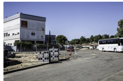
Devant l'entrée de la cité scolaire