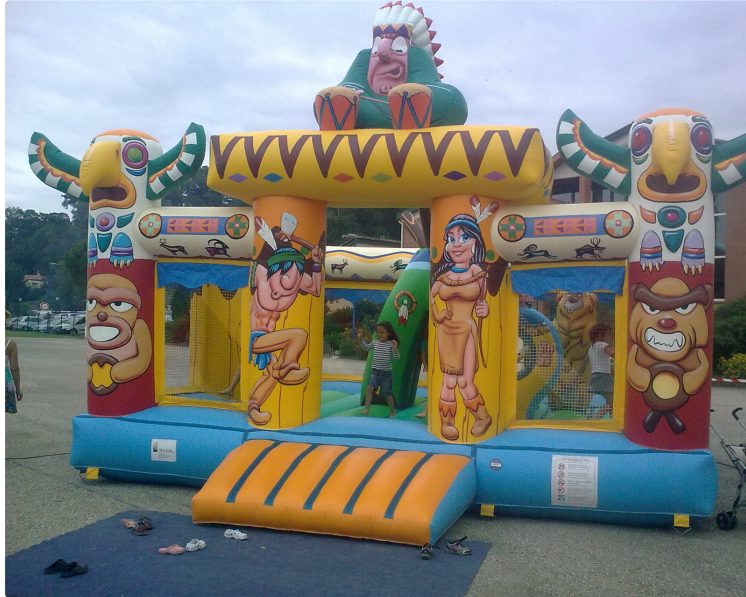
ISLE DE NOE : Les petits comme les grands s'amuse dimanche

Féria gonflée et Interville entre autres