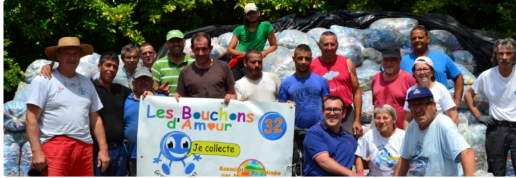
Les Bouchons d'Amour : 11 tonnes de bouchons plastiques expédiés en Belgique