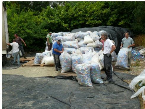
11 tonnes de bouchons, cela fait du volume.