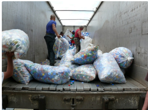
Ou on vide carrément les sacs dans la semi-remorque.