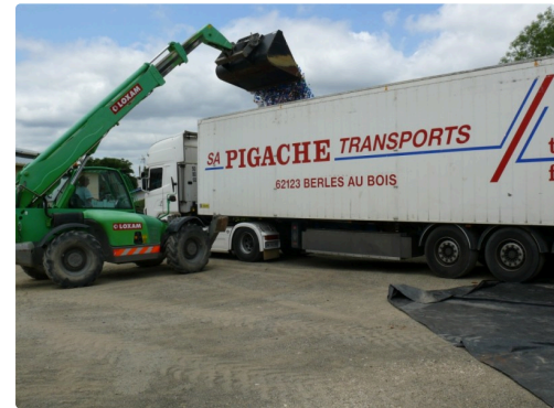
Puis on le vide dans la semi-remorque ...