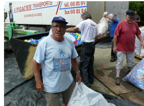
Lulu toujours présent pour la bonne cause.