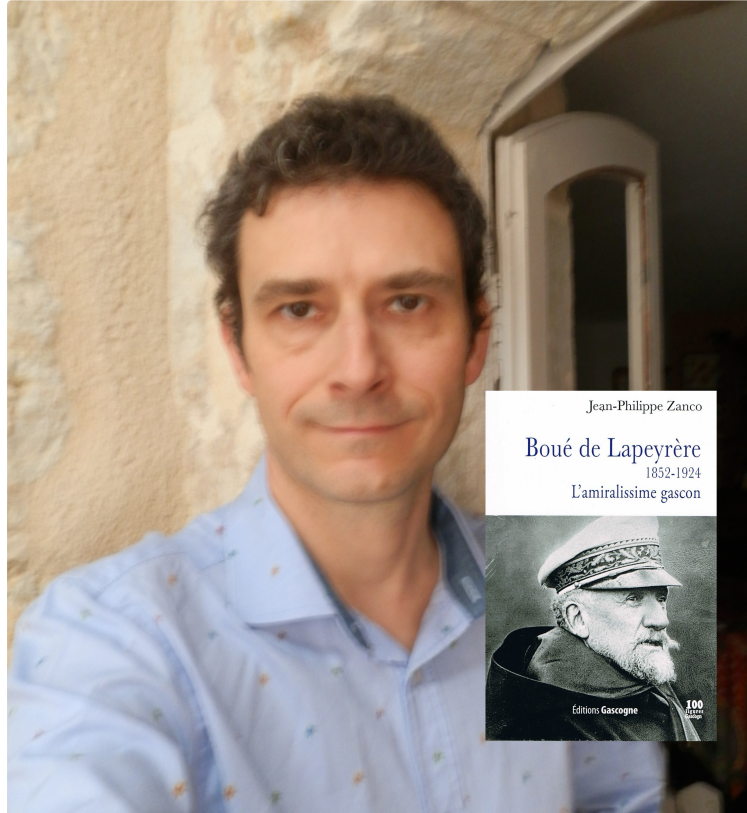
Le Gers une terre de marins ?

L'amiral Boué de Lapeyrère, natif de Castéra-Lectourois, en est un