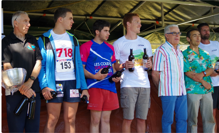
Des nouvelles (bonnes) de l'Athlétic Club Auscitain

Ses champions se distinguent sur les compétitions estivales