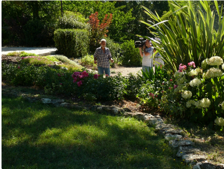
Castin : TF 1 a filmé le village aux deux fleurs

La chaîne de télévision TF 1 vient de rendre visite au village de Castin pour réaliser un reportage sur son fleurissement. Ce n'est pas tout à fait par hasard si la caméra y soit venue car depuis 2010 la commune est labellisée deux fleurs dans le cadre des villes et villages fleuris. Une constance qui est en passe de gravir l'échelon supérieur, les trois fleurs, tant les efforts d'embellissement sont de plus en plus notoires. Le maire Joël Mignano s'en défend : « Pour moi, avoue-t-il, l'objectif est de conforter la seconde fleur pour la commune. Pour la troisième fleur ce n'est pas à moi d'en parler ».