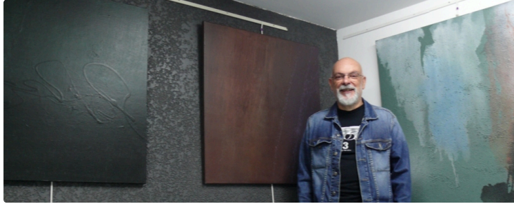
"L'abstrait minimaliste " de Philippe Magnard à découvrir à la galerie Nou'Arts à Auch jusqu'au 30 juillet

Il est grand temps d'aller visiter la galerie Nou'Arts et plus particulièrement son premier étage où le peintre Philippe Magnard expose jusqu'au 30 juillet une quinzaine de toiles. Ce n'est pas du brut de décoffrage mais c'est tout simplement génial. Des tableaux unicolores dont la couleur est triturée avec douceur et finesse pour mieux vous ensorceler. Car vraiment l'artiste sort des sentiers battus en sachant prendre des risques sans pour autant être insolent envers le visiteur.