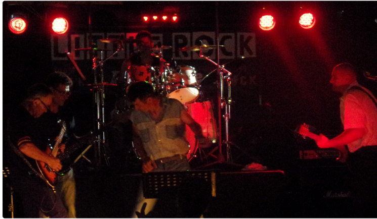
Fête locale lisloise