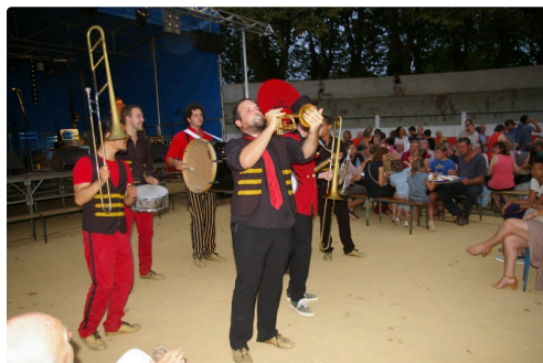
En images la soirée 2015