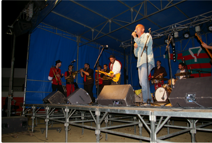
Soirée Esbouhats du jazz