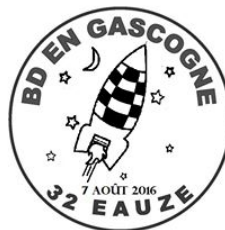
timbre BD eauze 2016.jpg