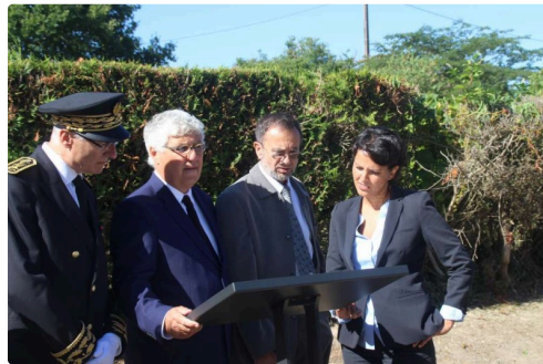
Les personnalités ont fait le parcours à pied jusqu'à la troisième plaque au carrefour de la Jalouse.