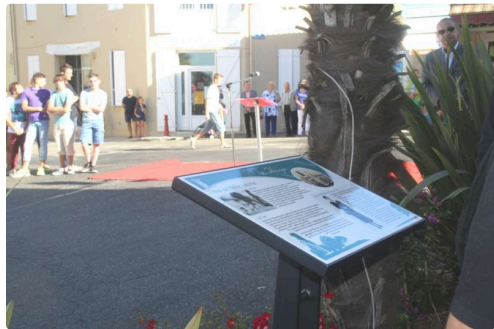
Le Pupitre explique le drame survenu en ce lieu.

Samedi matin, 6 août, à côté de la mairie, face à ce qu'était en 1944 l'Hôtel Lafontan, en présence des autorités civiles et militaires, d'anciens combattants et des habitants de la commune, madame la Ministre de l'Education Nationale, de l'Enseignement Supérieur et de la Recherche, Najat Vallaud-Belkacem a inauguré le Parcours de Mémoire du 6 août 1944. La cérémonie s'est prolongée à Toujouse, au bois de Bascaules, devant le monument des trois jeunes fusillés par les allemands.