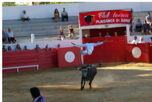
Et un saut de l'ange de Laplace