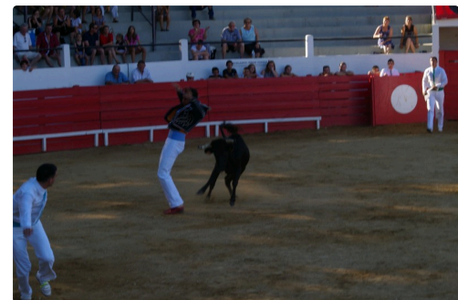
La première sans corde issue du Lartet