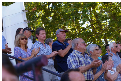
Une salve d'applaudissements pour les quatre bénévoles disparus