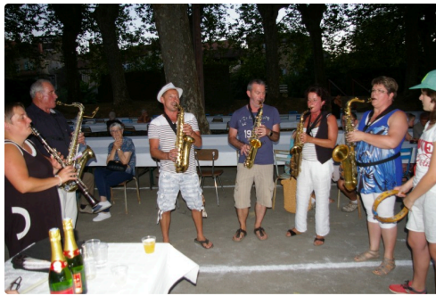
Ils ont sauvé musicalement la course