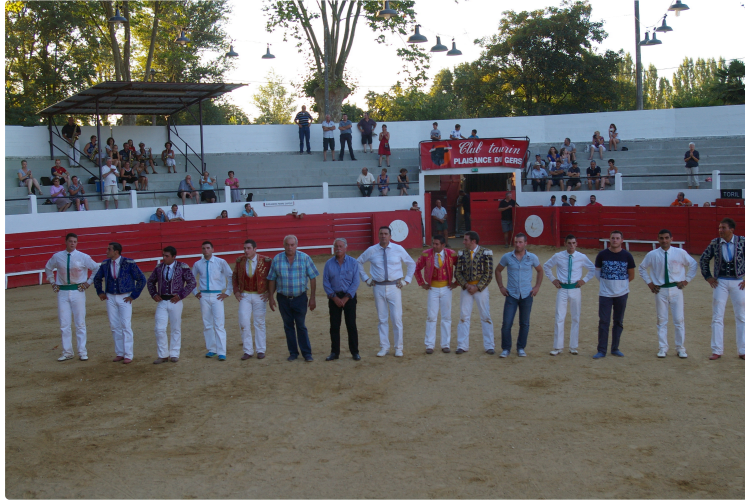
Course Landaise d' Août