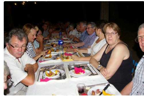
Le repas du soir a réuni de nombreux convives