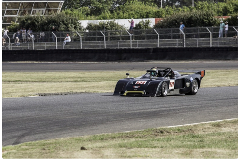
Sport Proto Cupcourse 2