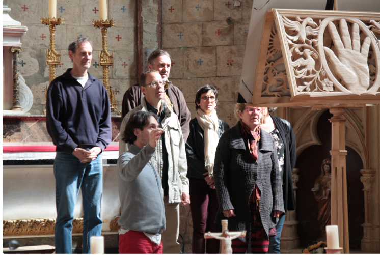
LA ROMIEU: LA CROISEE DES VOIX samedi 17 septembre de 11h30 à 19h00