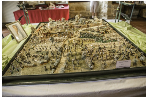
Vue d'ensemble de la maquette avec ses centaines de figurines