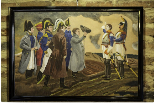
Copie de tableau par Jean Fléveau avec Napoléon et sa suite