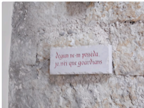
La devise Gasconne " dans la tour "Personne ne me possède je n'ai que des gardiens"