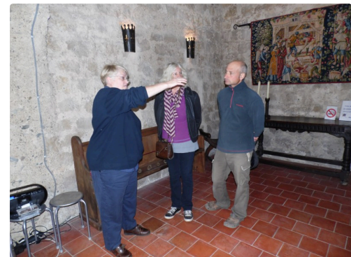
Rosanne commente une visite