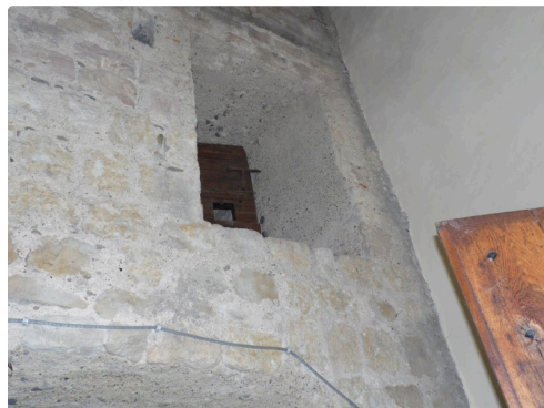
L'a porte d'entrée de la prison