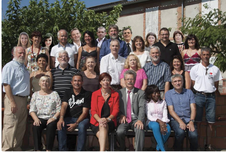
Soutien à l' Alternative pour St Lys

Suite à l'impossibilité de gérer la ville de Saint-Lys et de ses 10000 habitants, les élections municipales partielles ont été ordonnées par l'État. Le premier tour de dimanche 11 septembre a été favorable aux deux listes opposantes au maire sortant.