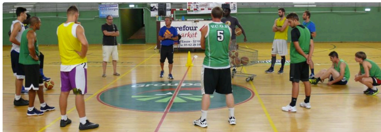
Basket-ball, nationale 2 masculins : Valence-Condom reçoit Garonne ASPPT Basket

Premier match de la saison pour le VCGB qui déjà affronte un cadreur de la poule